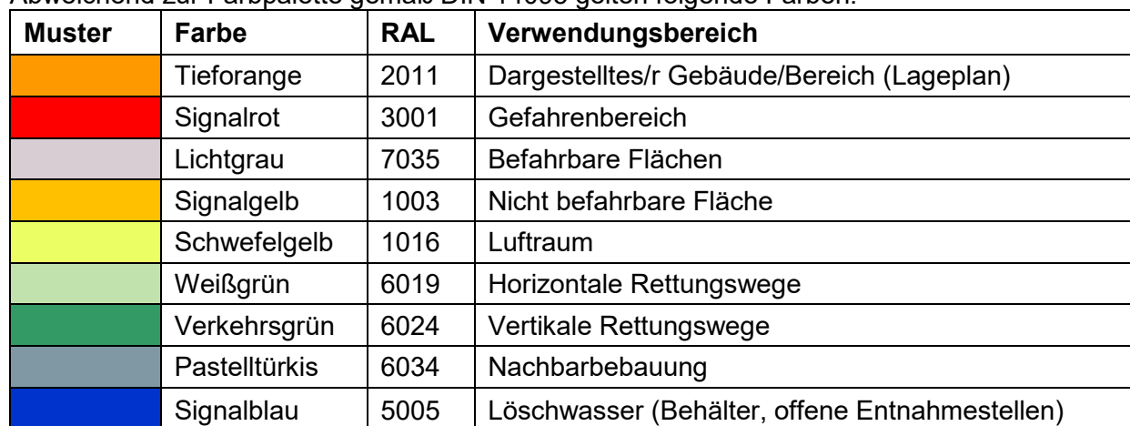
Tabelle 1: Farbgestaltung

Abweichend zur Farbpalette gemäß DIN 14095 gelten folgende Farben: