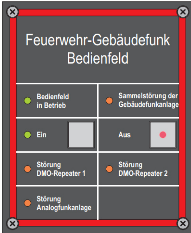
Beispiel DMO Anlage